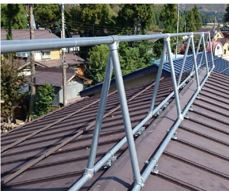
①-1 固定アンカー(単管型)