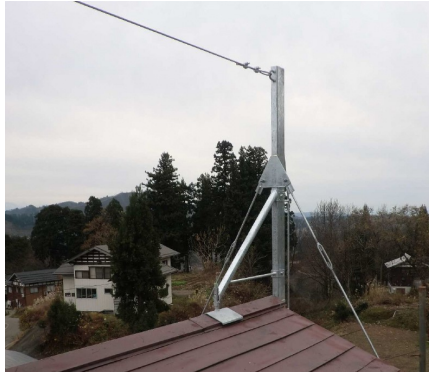
①-2 固定アンカー(ワイヤー型)